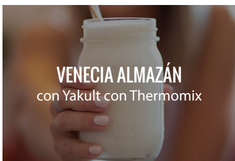
VENECIA ALMAZÁN con Yakult con Thermomix