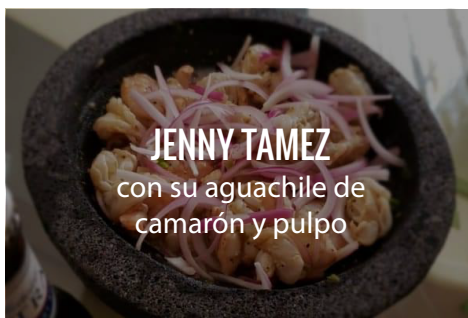
JENNY TAMEZ con su aguachile de camarón y pulpo