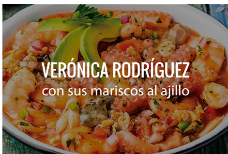
VERÓNICA RODRÍGUEZ con sus mariscos al ajillo