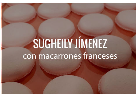
SUGHEILY JÍMENEZ con macarrones franceses