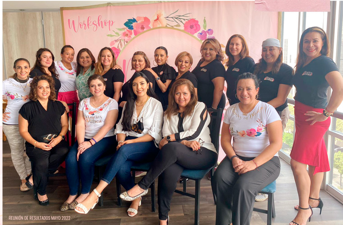
REUNIÓN DE RESULTADOS MAYO 2022

Viene los meses de fiesta y tú debes estar ahí, ¡Siempre en POTENCIA!