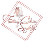
CONSIENTE A MAMÁ con un pastel único.